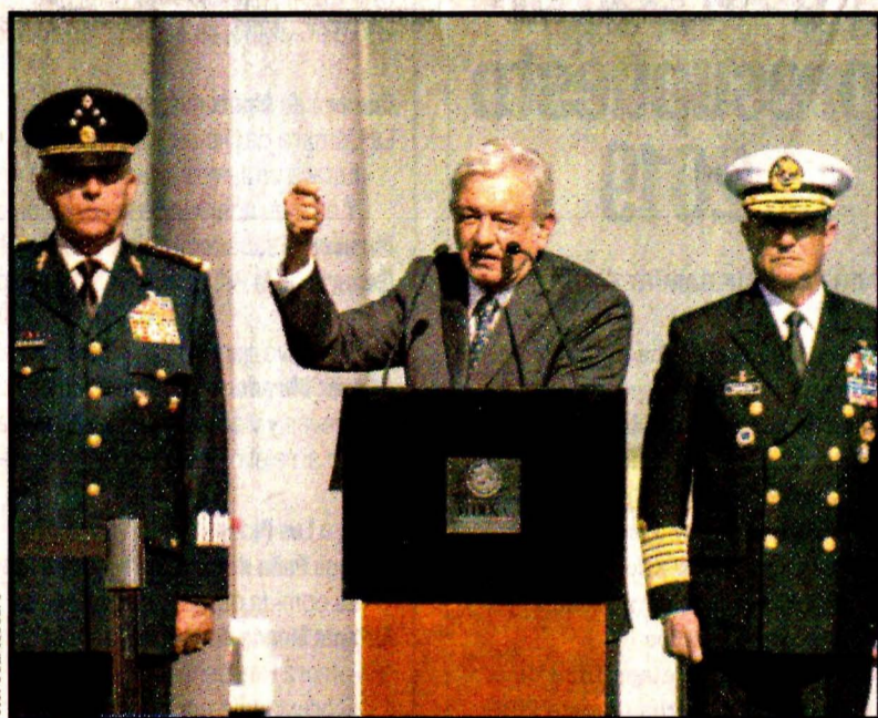
Andrés Manuel López Obrador, Salvador Cienfuegos y Vidal Soberón.

Vengo a convocarles para que juntos, de conformidad con la Constitución, podamos enfrentar el grave problema de la inseguridad y de la violencia en nuestro país".