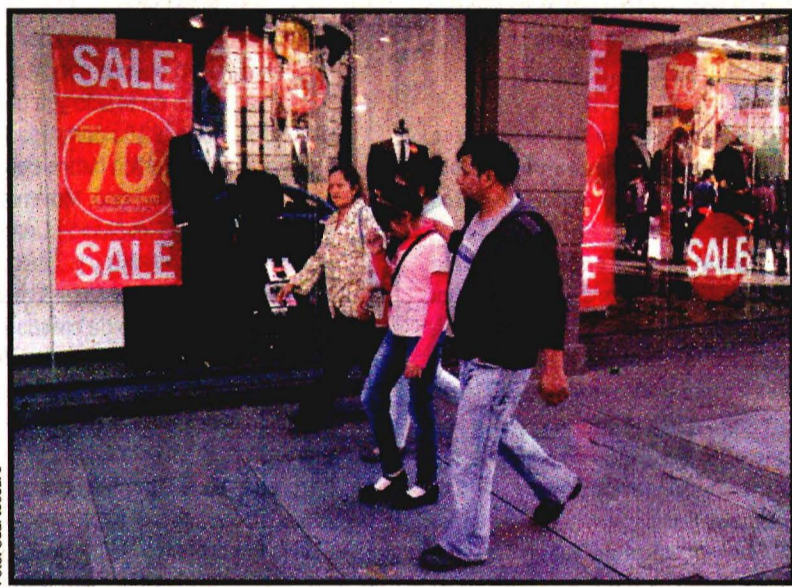
Ofertas de inicio de año.

Comentó que volvió a encenderse el motor exportador y aunque la actividad industrial atraviesa por una etapa difícil, su principal componente, la producción manufacturera, ofrece resultados alentadores.