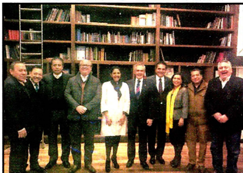
Miguel Ángel Mancera recibió el respaldo de todo el PRD para ser candidato a la Presidencia. El se dice dispuesto a competir, pero mantiene la idea del Frente.