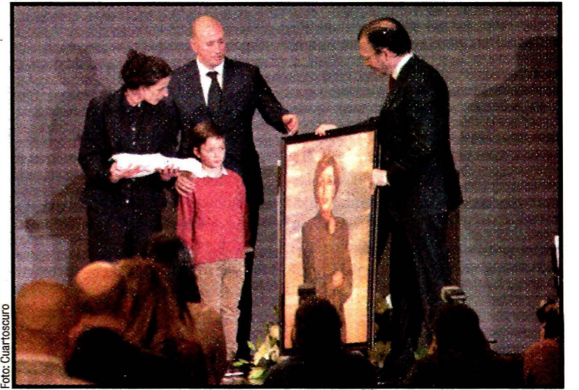
Luis Videgaray encabezó un homenaje a Rosario Green, ex canciller recientemente fallecida. Asistió su familia.