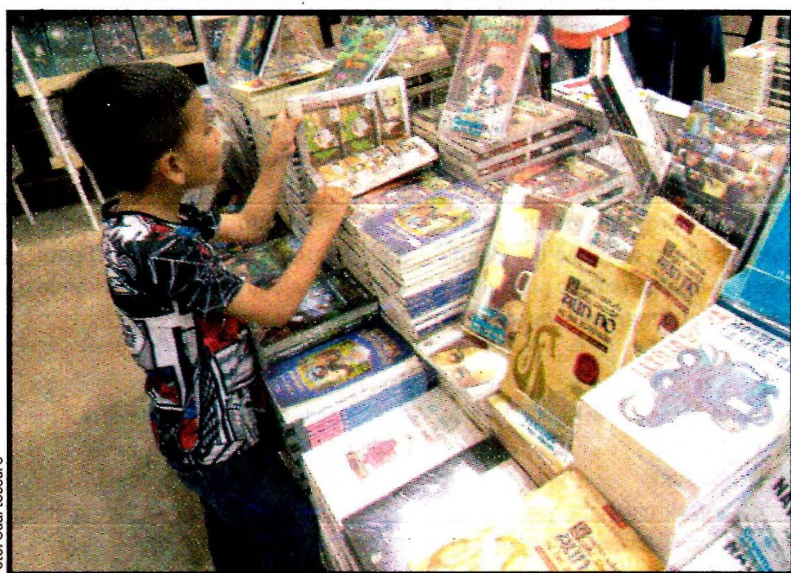
Lectura infantil, un gran atractivo en la edición 40 de la Feria Internacional del Libro en el Palacio de Minería, por cuyos pasillos han desfilado miles de lectores.