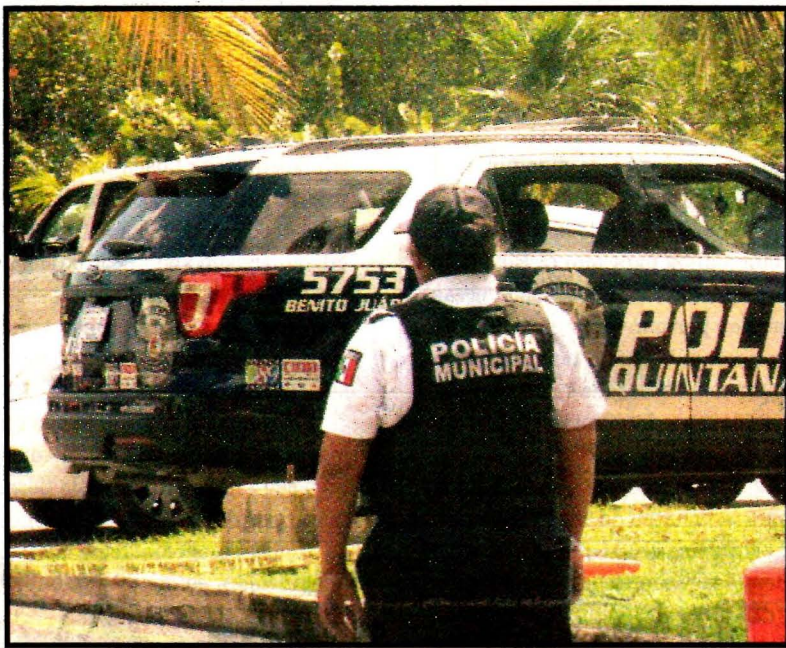
CANCUN, QR.- Preocupa la incidencia delictiva.

Por otro lado, el comandante de la Policía Municipal de Solidaridad fue asesinado afuera de