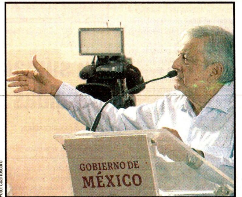
EL ROSARIO, Sin.- Andrés Manuel López Obrador. Se notará el cambio.

Andrés Manuel López Obrador Presidente de México