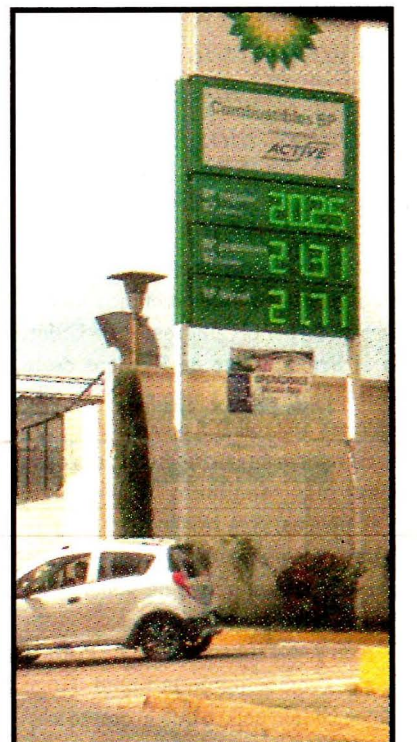
De 20.25 a 20.39 y más, el litro de magna en la zona metropolitana.