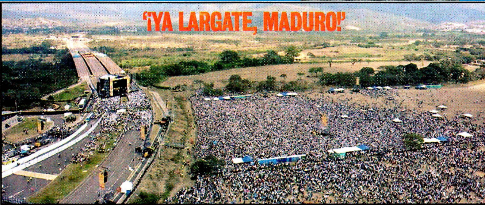
CUCUTA, Colombia.- Al menos 300 mil asistentes al concierto contra el régimen de Maduro. Artistas latinos exigen la salida del mandatario venezolano.