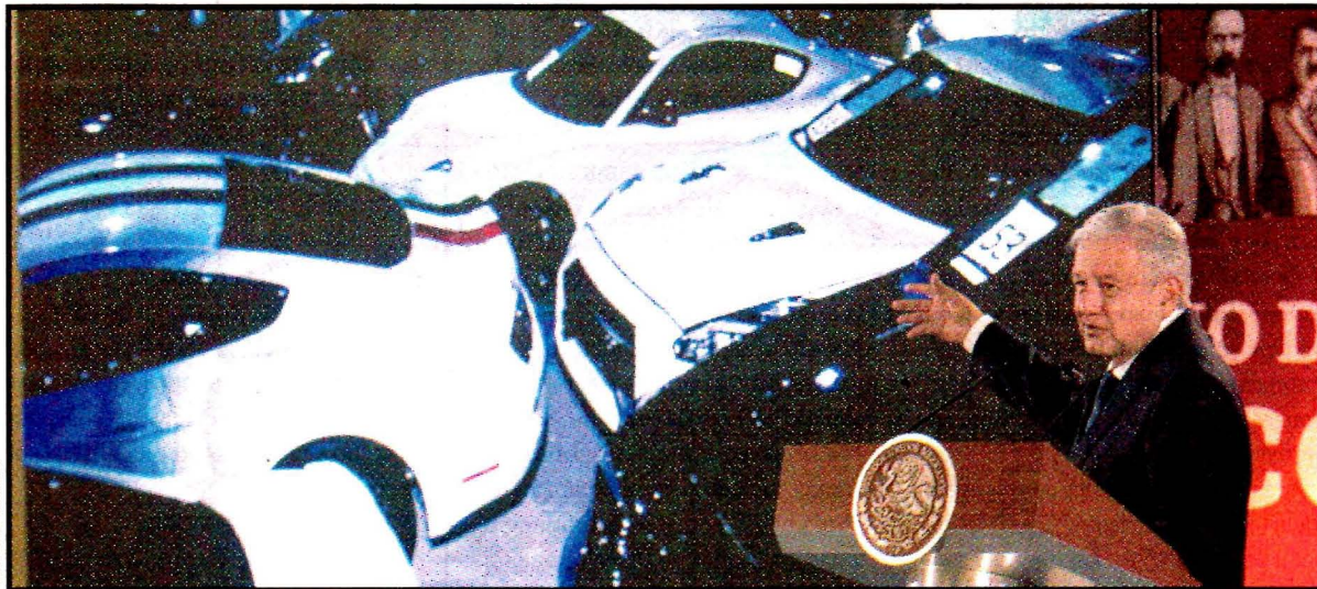
Andrés Manuel López Obrador. Guardia, consulta para termoeléctrica en Morelos y subasta de autos, entre los temas.