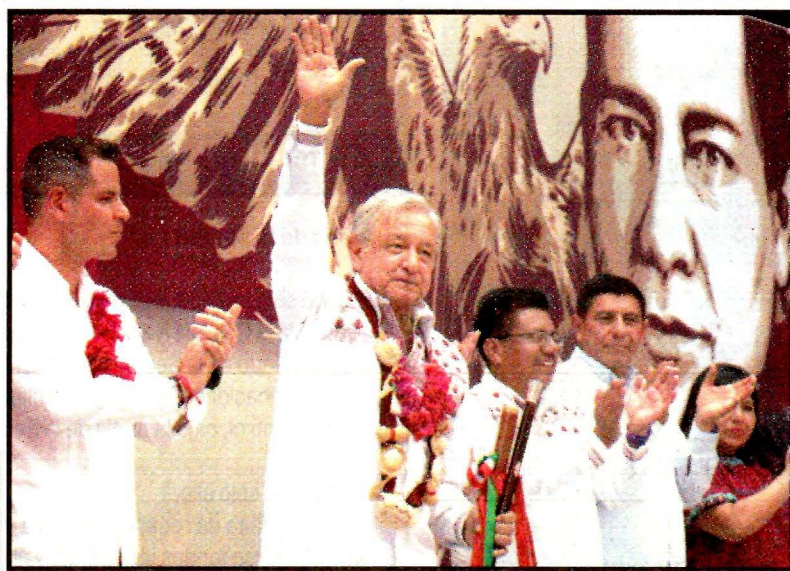
OAXACA, Oax.- Andrés Manuel López Obrador y Alejandro Murat. Arranque del programa para atender a las culturas locales.