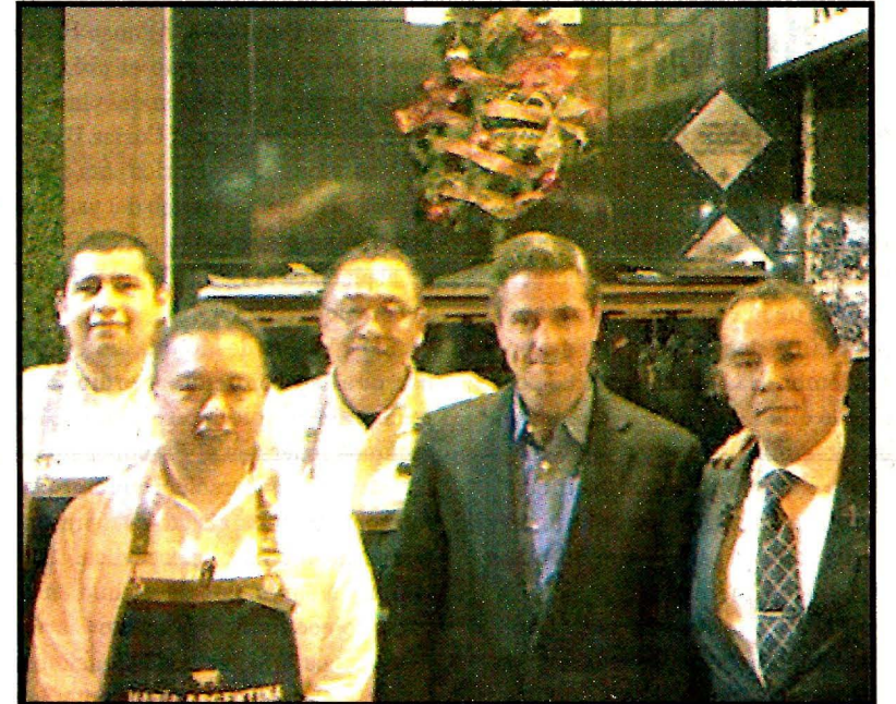
METEPEC, Méx.- Enrique Peña Nieto, en un restaurante del Estado de México. Ver página 3