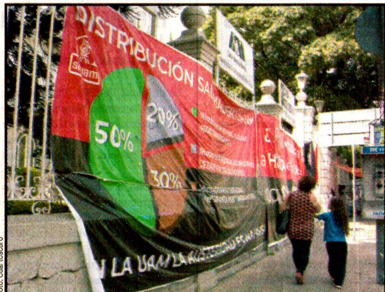
De nuevo fracasó la negociación entre autoridades de la universidad y el sindicato de trabajadores. Ver página 5