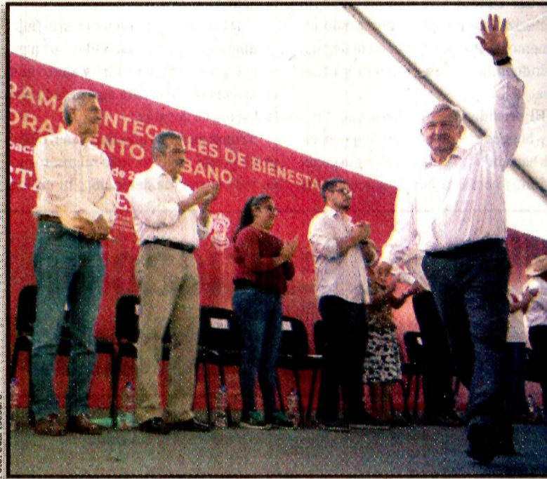
URUAPAN, Mich.- Andrés Manuel López Obrador. Atención inmediata.

Aclaró que su escolta será eficiente, de sólo ocho elementos, temporal y no se caerá en los excesos que mantenían antes del 1 de diciembre de 2018. Más tarde, tras la dureza del reclamo, Fox agradeció la pronta respuesta del presidente para brindarle seguridad. A través de su cuenta en Twitter, expresó su agradecimiento “a nombre personal y de mi familia”, al tiempo que desoó “paz y seguridad para mi país”.