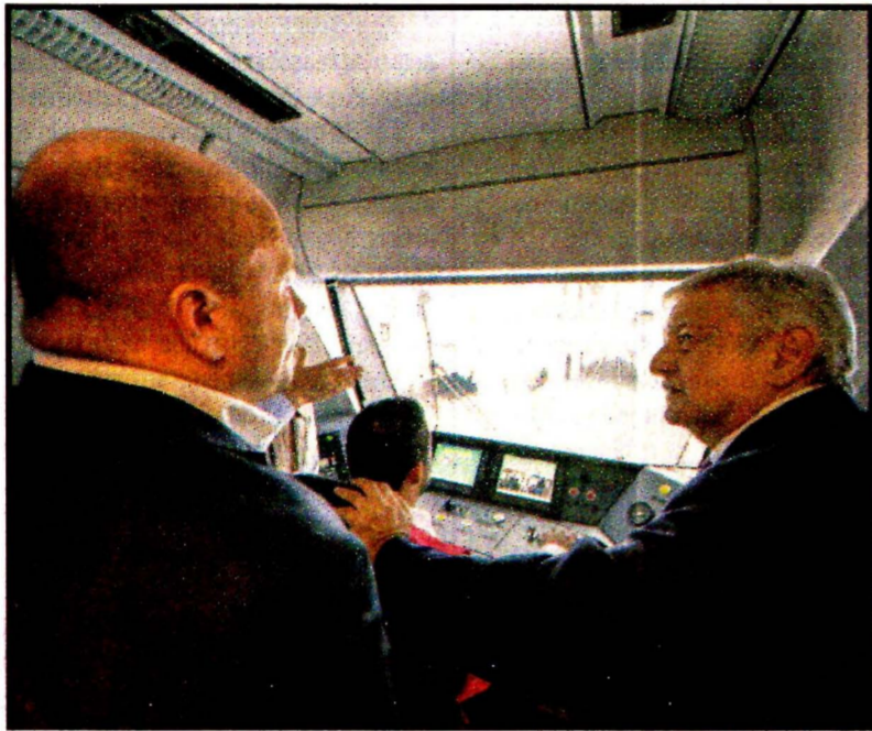
GUADALAJARA, Jal.- Andrés Manuel López Obrador y Enrique Alfaro. Recorrido por las obras de la Línea 3 del tren ligero. Ver página 3