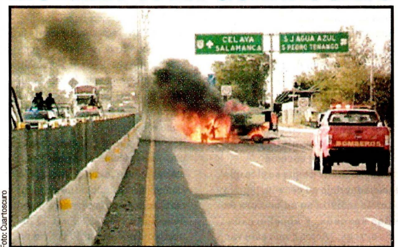
APASEO EL ALTO, Guanajuato.- Once presuntos criminales murieron en operativo de fuerzas federales contra la ordeña de combustible.