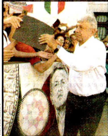
QUERETARO, Qro.- Andrés Manuel López Obrador.

En conferencia de prensa luego de su reunión privada con el gobernador de Querétaro, Francisco Domínguez Servián, aseguró que se comprometió con el