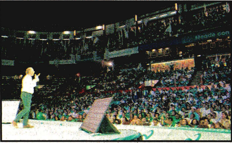
José Antonio Meade. Encuentro con Nueva Alianza en la Arena México.