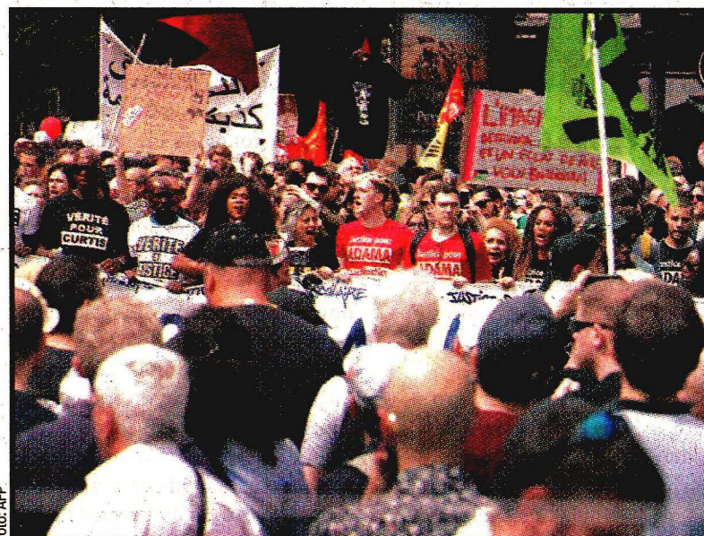
Miles de franceses tomaron nuevamente las calles en protesta contra las reformas financieras del presidente Emmanuel Macron.