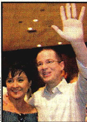
SAHUAYO, Mich.- Ricardo Anaya.