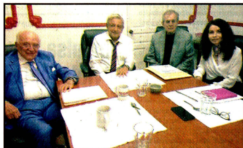
Andrés Manuel López Obrador. Reunión de trabajo.

"No puede haber gobierno rico con pueblo pobre", dijo y adelantó que las modificaciones a Ley Orgánica de la Administración Pública Federal están encaminadas a construir y consolidar la austeridad republicana y la honestidad como signo distintivo de su gobierno.