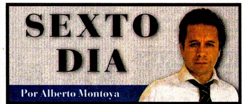
Por Alberto Montoya

Jamás importó la seguridad; crimen se infiltró en elección