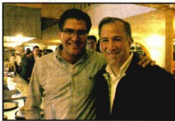
José Antonio Meade y Armando Ríos Piter.

Tras una hora de platicar y comer tacos, ambos hicieron oficial ante los medios de comunicación lo que desde la mañana se intuyó, cuando Meade Kuribrea le hizo una invitación.