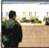
QUERETARO, Qro.- Diligencia.