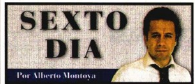
Por Alberto Montoya