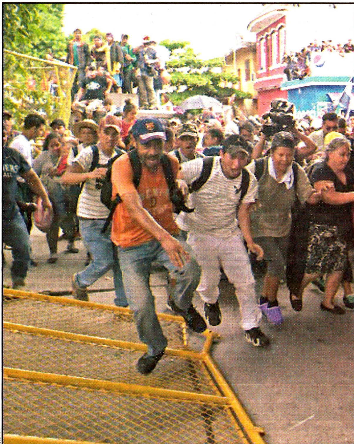
CIUDAD HIDALGO, Chiapas.- La reja que divide a México y Guatemala fue derribada. La Policía Federal