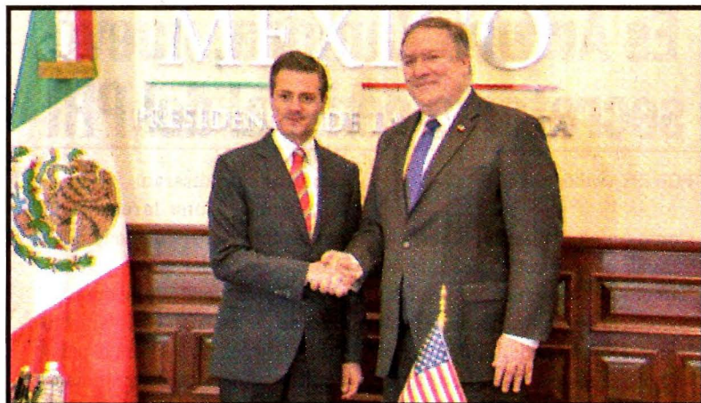
Enrique Peña Nieto y Michael Pompeo.

En un mensaje difundido a través de medios de comunicación y redes sociales, sentenció que México mantiene su disposición de apoyar a quienes quieran ingresar el país, respetando el marco legal vigente.