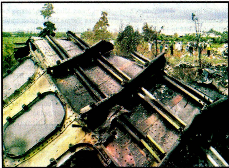
LA HABANA, Cuba.- Esperan información de la caja negra.