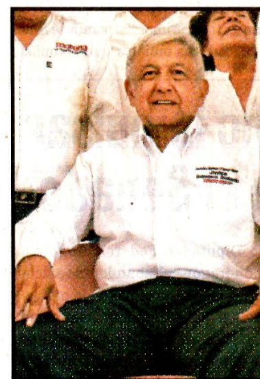
JOCOTEPEC, Jal.- Andrés Manuel López Obrador.