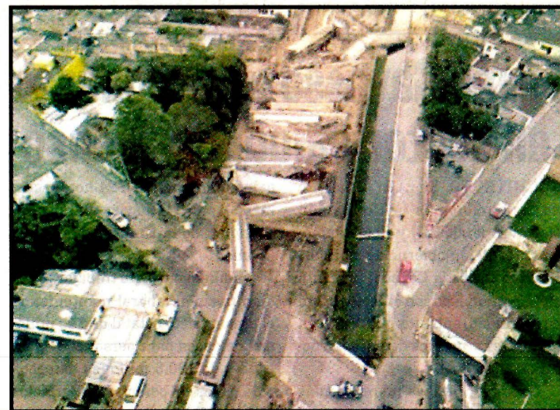
VERACRUZ, Ver.- Impunes, los ataques perpetrados por criminales.