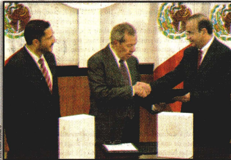
Porfirio Muñoz Ledo recibe una copia del sexto informe de gobierno de manos de Alfonso Navarrete Prida. Observa Martí Batres.