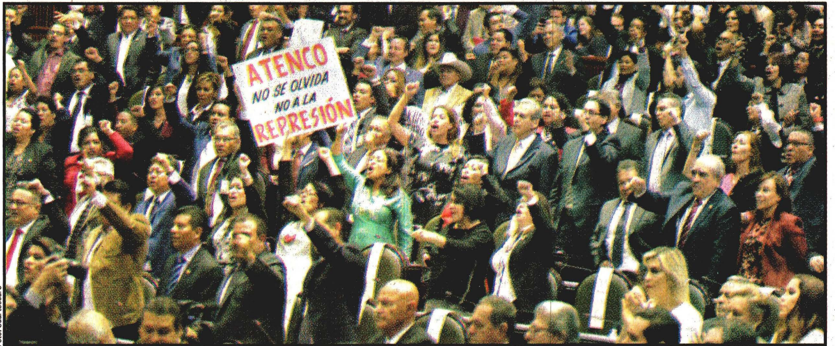
Morena deja sentir su aplastante mayoría en la primera sesión de la Legislatura LXIV.