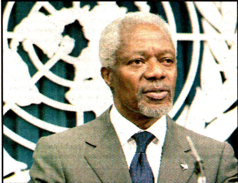
GINEBRA, Suiza.- El ex secretario general de la ONU y Nobel de la Paz, Kofi Annan, murió ayer tras una recaída de su estado de salud.