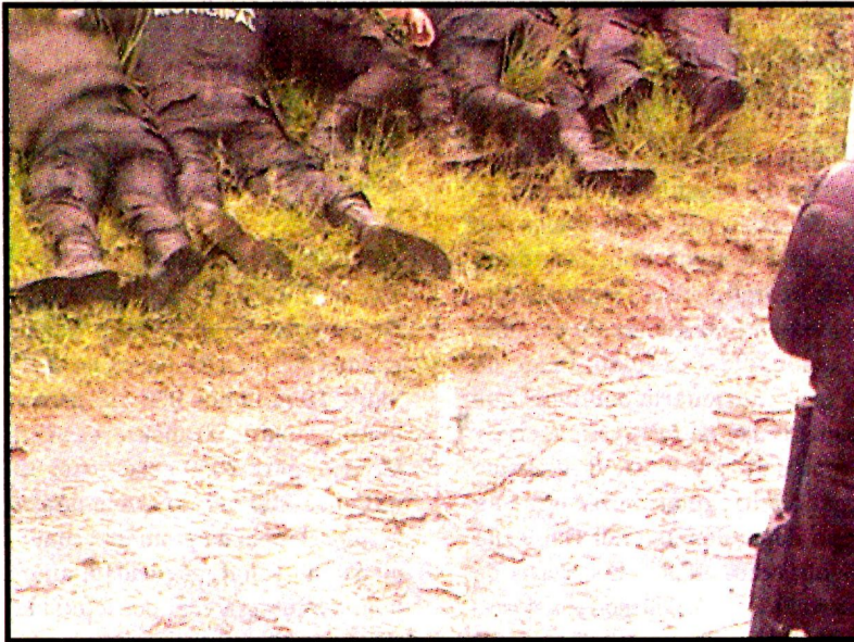
AMOZOC, Puebla.- Cinco hombres y una mujer fueron atacados por ladrones de combustible, llamados huachicoleros. Escaparon.