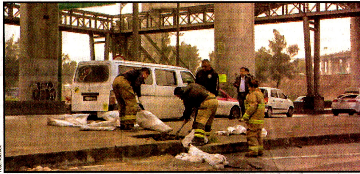
Lodo, basura y toda clase de objetos fueron retirados por bomberos y elementos de Protección Civil y limpieza del gobierno capitalino y las delegaciones.

"Estos cuerpos receptores se saturan de agua y esperan a que poco a poco se vayan abriendo las compuertas, vayan hacia el drenaje principal. Estuvimos en la barranca Río Becerra, bueno en el cuerpo