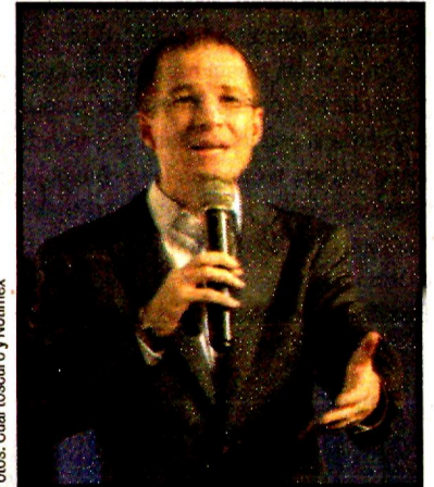
ZAPOCAN, Jal.- Ricardo Anaya Cortés.