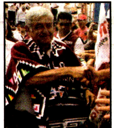
URUAPAN, Mich.- Andrés Manuel López Obrador.

“ En un sexenio le damos la vuelta a la corrupción. No es con personalismos voluntaristas o porque llegue un iluminado con ínfulas de perdonavidas. La clave es la reforma al artículo 102”.