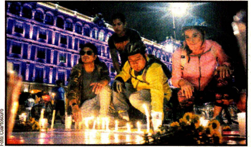
Duelo en CDMX por el asesinato de los ciclistas alemán y polaco, en Chiapas. La Fiscalía confirmó el doble homicidio.