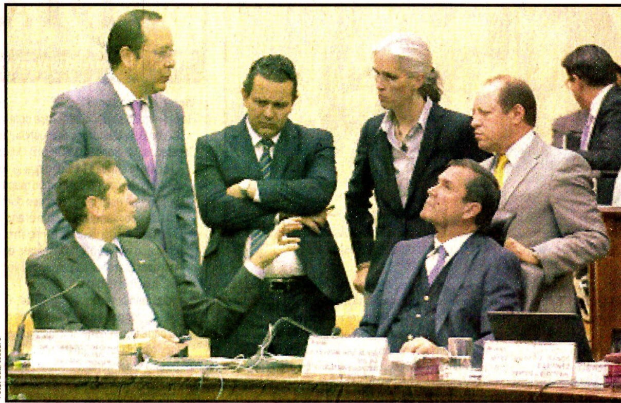
Lorenzo Córdova. Sesión.

“Y lo que las y los ciudadanos pueden decidir es una elección que se resuelva con márgenes holgados