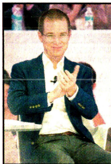
Ricardo Anaya Cortés.

improvisar, y por lo tanto, se prepara para cualquier escenario que