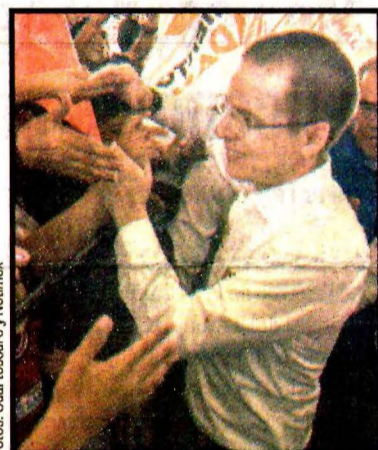
HUEHUETOCA, Méx.- Ricardo Anaya Cortés.