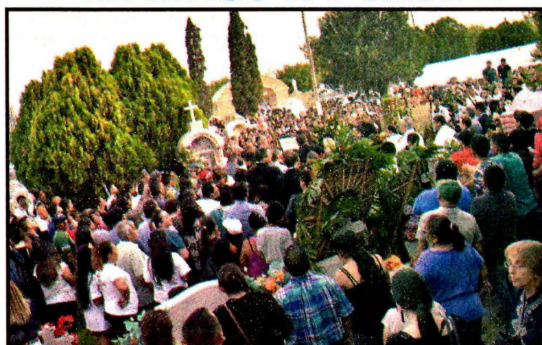
SALTILLO, Coah.- Consternación entre familiares y amigos.