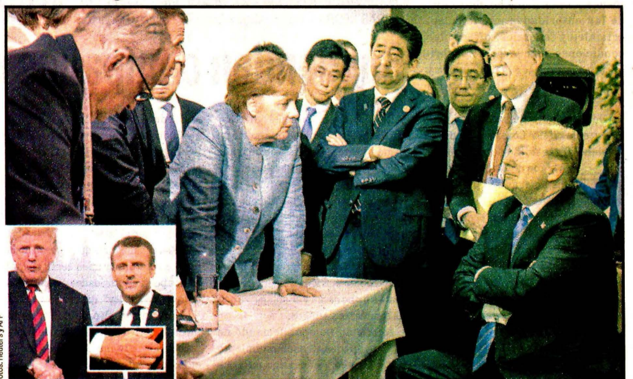
LA MALBAIE, Canadá.- Dominaron el choque y la discrepancia. En el recuadro, la mano de Donald Trump tras un marcado apretón de manos con Emmanuel Macron.

El presidente se expresó duramente contra Trudeau, quien como anfitrión de la Cumbre asumió la conducción de las deliberaciones y divulgó sus resultados.