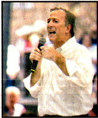
José Antonio Meade Kuribreña.