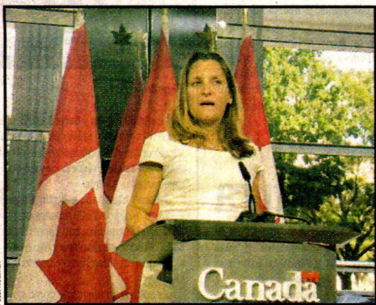
WASHINGTON, EU.- Chrystia Freeland.

"Ganar-ganar-ganar" ¿Es posible salvar el TLCAN vigente desde 1994, que Trump considera "un desastre" y que los tres socios