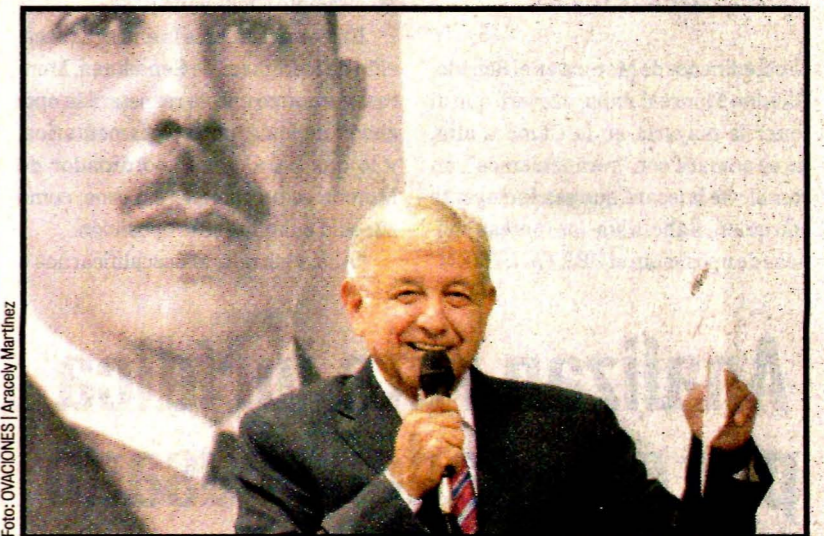
Andrés Manuel López Obrador. Recibió una propuesta de una empresa de Florida, que pretende rentar 25 aeronaves.