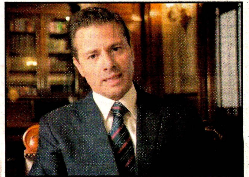
Enrique Peña Nieto. Respeto absoluto a la libertad de expresión y crítica en su gobierno, asegura. Continúan spots por su sexto informe.