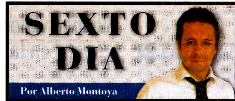
Por Alberto Montoya