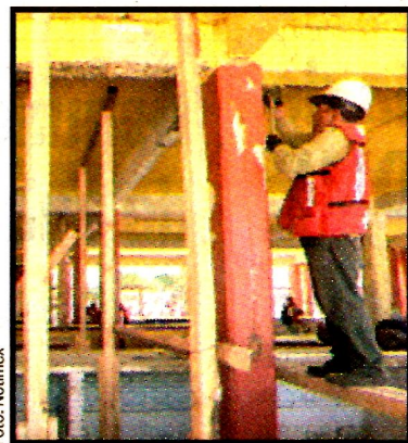
RECONSTRUCCION JUCHITAN, Oax.- Trabajos en el mercado municipal.