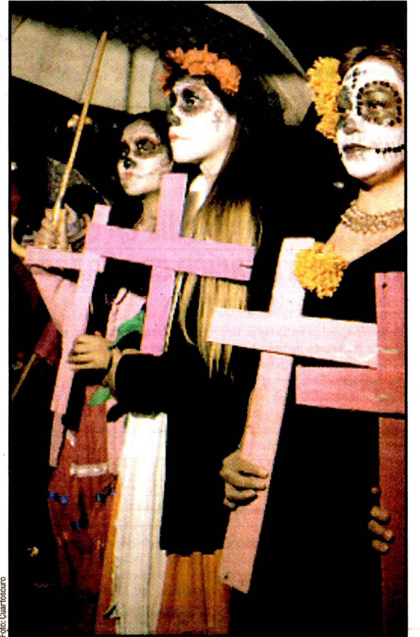
Al Hemiciclo a Juárez. Protesta contra los asesinatos de mujeres, principalmente niñas.