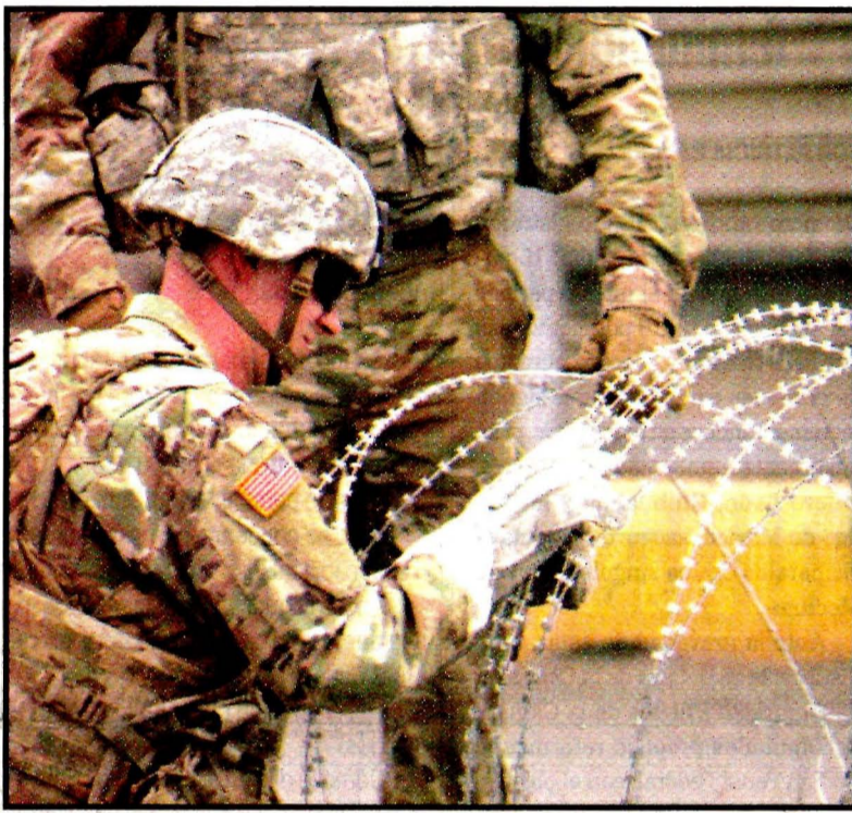
HIDALGO, Texas.- Se preparan para la llegada de los centroamericanos.