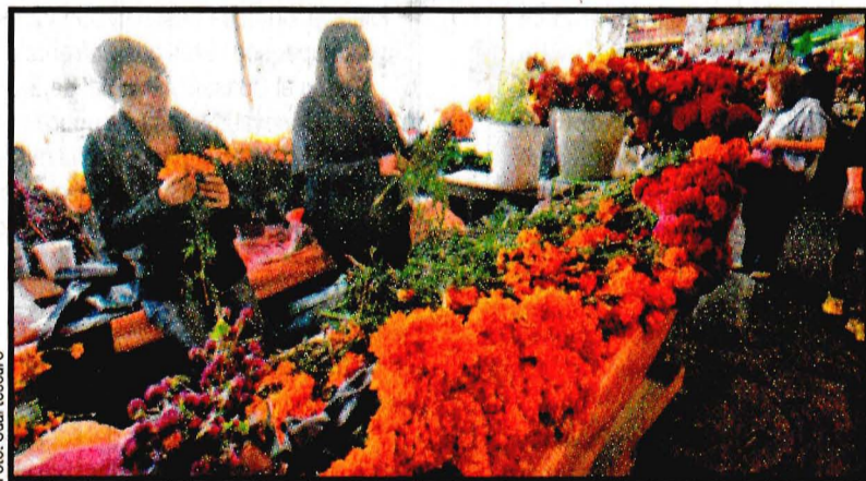
La Ciudad de México lidera en producción y venta de flor de campesúchil. En la imagen, oferta en el mercado de San Cosme. Ver página 8