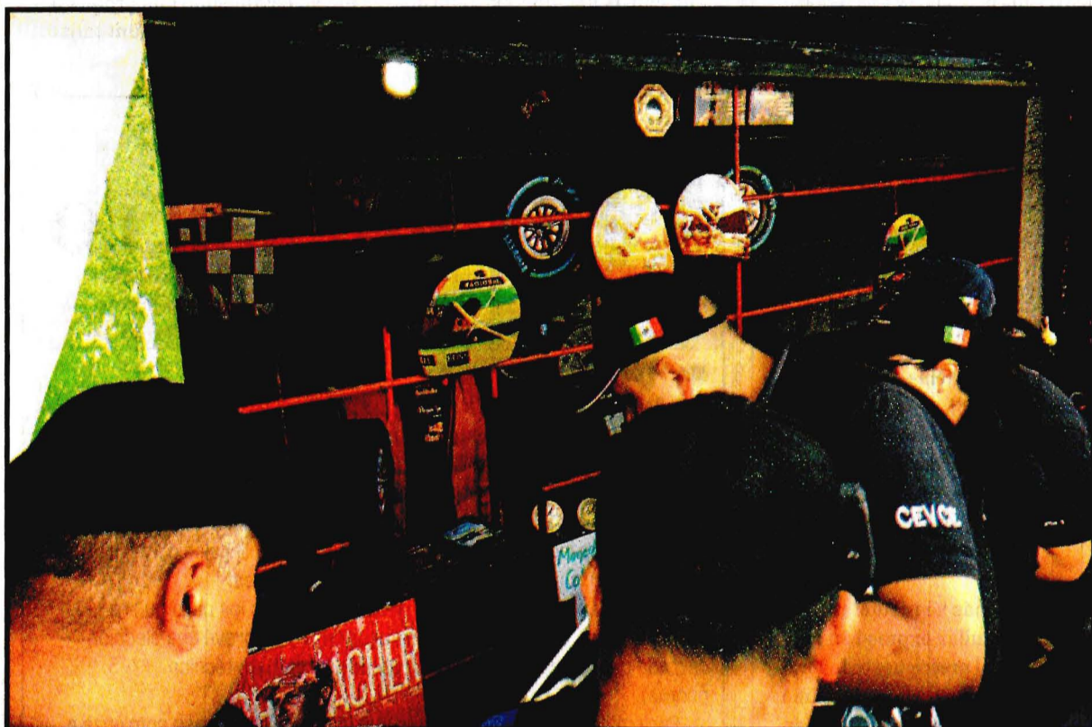
Autoridades capitalinas realizaron un operativo en inmediaciones del Autódromo Hermanos Rodríguez contra la venta de artículos pirata con distintivos de Fórmula 1. Ver página 8