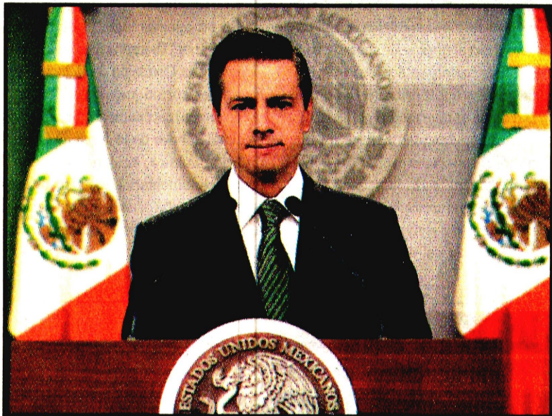
Enrique Peña Nieto.