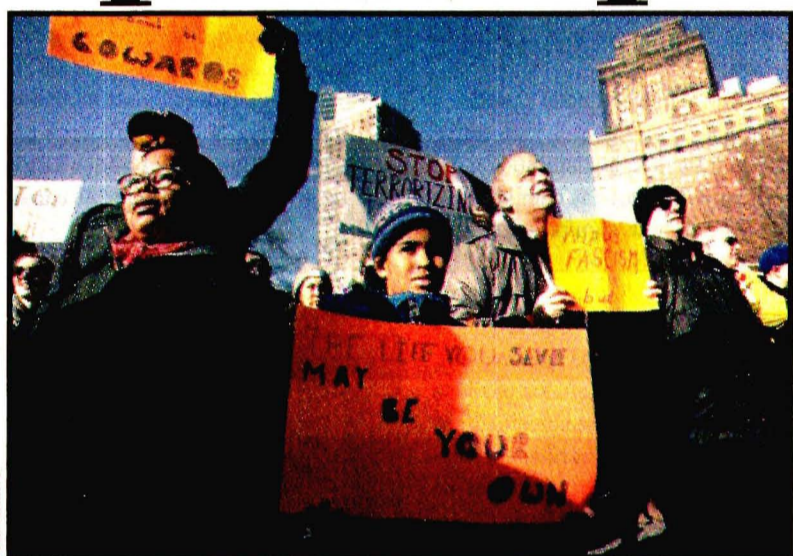
NUEVA YORK, EU.- Protestas por la prohibición de entrada a ciudadanos de siete naciones árabes.