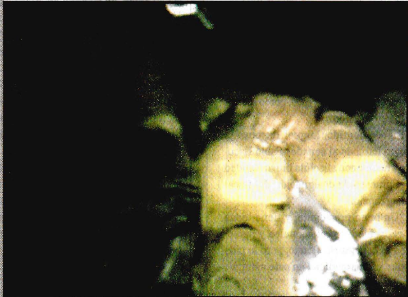
MORELIA, Mich.- Estaba a 150 metros de profundidad.