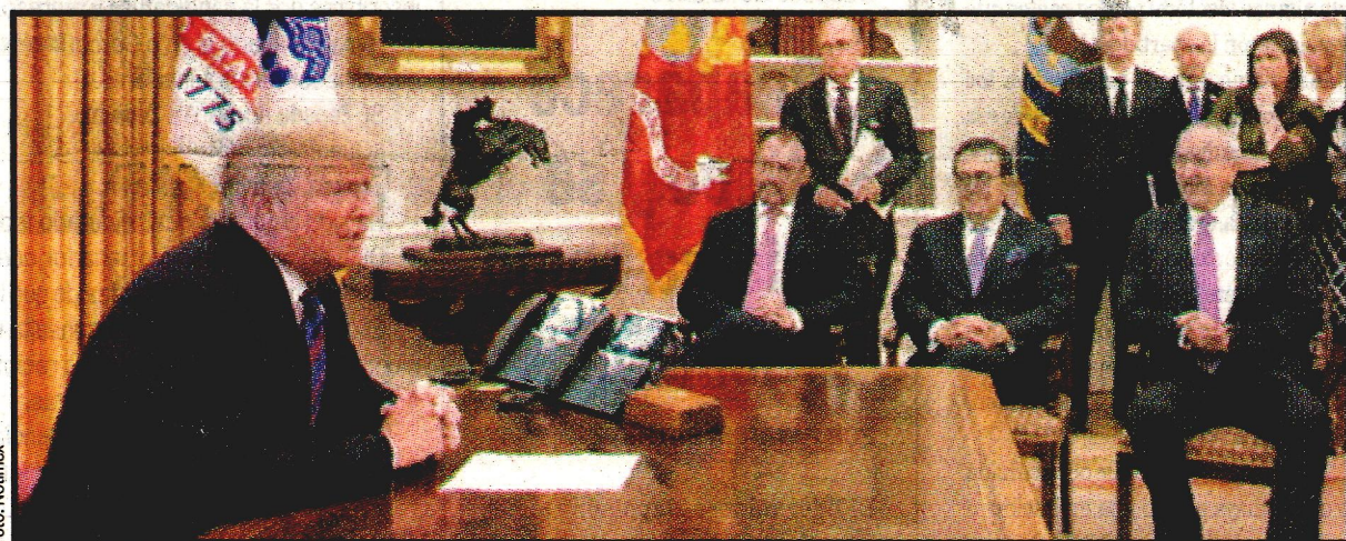
WASHINGTON, EU.- Trump recibió en la Casa Blanca a Luis Videgaray, Ildefonso Guajardo y Jesús Seade. Ahí conversó con Enrique Peña Nieto.

“Ha sido grandioso en muchos sentidos y ama a su país, y quiere hacer lo correcto. Creo que