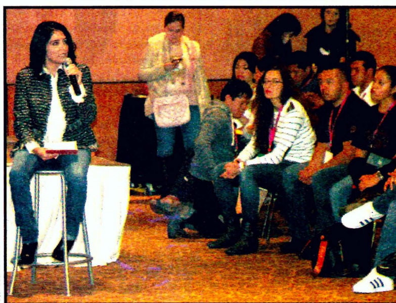
Alejandra Barrales. Líder del PRD. En el Estado de México se abrirá la elección de candidato a gobernador. Las alianzas, firmes pero en veremos.