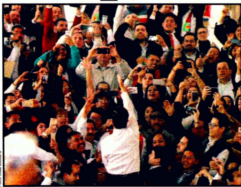
Enrique Peña Nieto. Consejo Político Nacional, en el PRI.

Luego de tardar más de 45 minutos en recorrer los pasillos donde se arremolinaban sus simpatizantes para llegar al templete y por momentos subido a los barandales para saludar, advirtió que quienes llegaron a