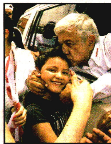
PARRAL, Chih.- Andrés Manuel López Obrador.