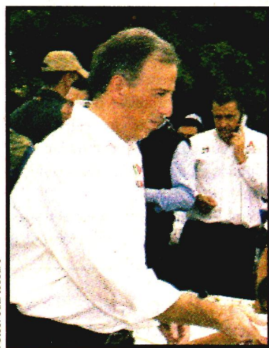
RIO BRAVO, Tamps.- José Antonio Meade Kuribrefa.

Precisó que el próximo 6 de mayo el INE imprimirá más de 270 millones de boletas para las elecciones federales, con altos mecanismos de seguridad, por lo que, si una candidatura de coalición o independiente declina de