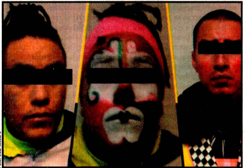
Una banda de plagiaros fue detenida con una niña en su poder. La atrajeron con argucias y dulces.