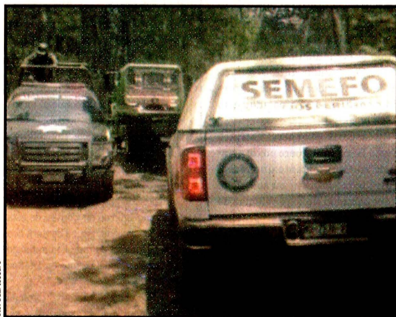
URUAPAN, Michoacán.- Los Viagra habrían puesto una trampa a integrantes del CJNG. Realizan los peritajes.