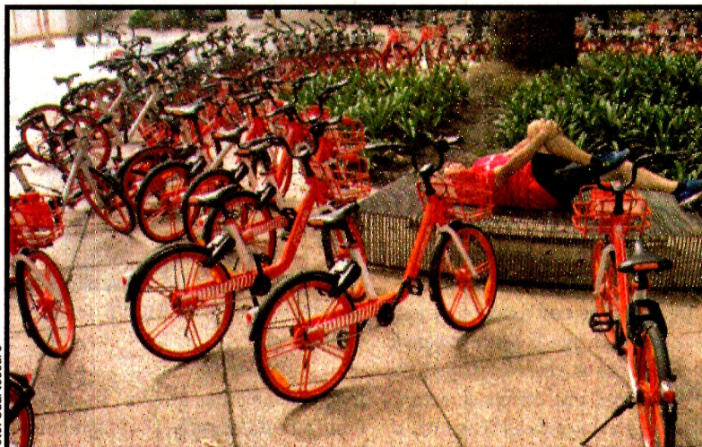
Se les encuentra abandonadas por cualquier parte de la ciudad. Los sistemas de renta de bicicletas sin anclaje mediante una App son cada vez más utilizados. Los usuarios las dejan donde se les ocurre.