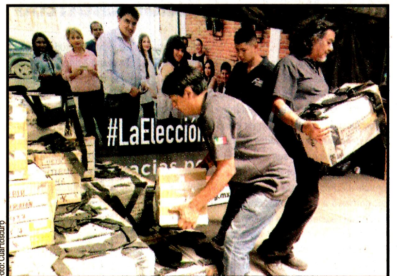
PUEBLA, Pue.- Ayer comenzó el traslado de todos los paquetes, para el recuento total de la elección para gobernador, tras la impugnación de Morena al triunfo del PAN.