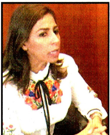
Marybel Villegas, senadora de Morena. Quintana Roo debe hacerse cargo del servicio de agua, dice.