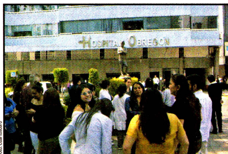
Temborl con epicentro en Oaxaca que se sintió ligeramente en la CDMX. No hubo daños.