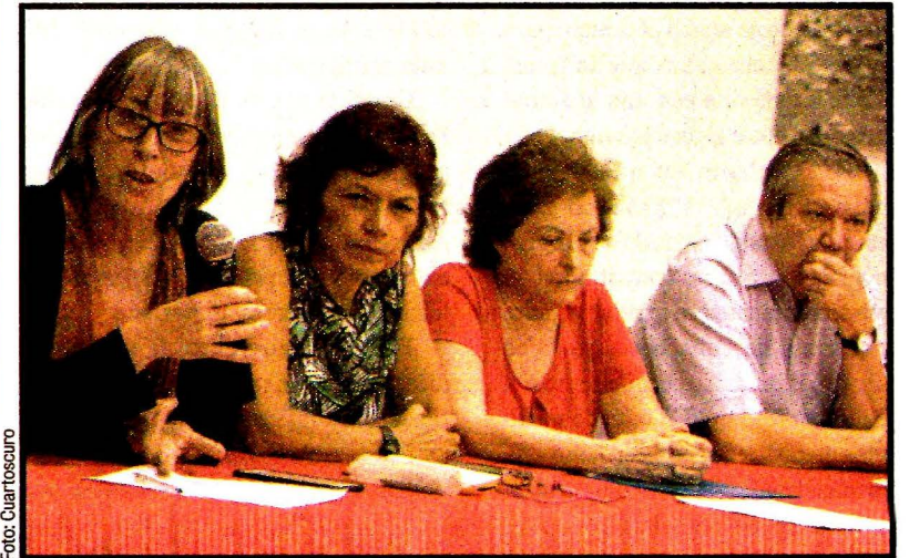
Maestros de la UAM marcharán el jueves para exigir que el sindicato abandone su actitud intransigente y acepte la oferta salarial de la universidad. Ya son 81 días de huelga.