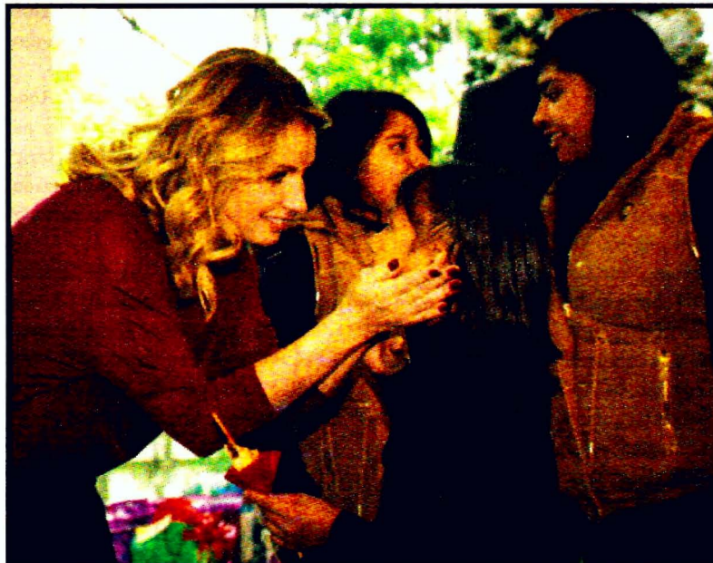
Angélica Rivera de Peña se reunió en Los Pinos con niños de dos casas hogar. "Es tiempo de generosidad y de abrir nuestros corazones", dijo.