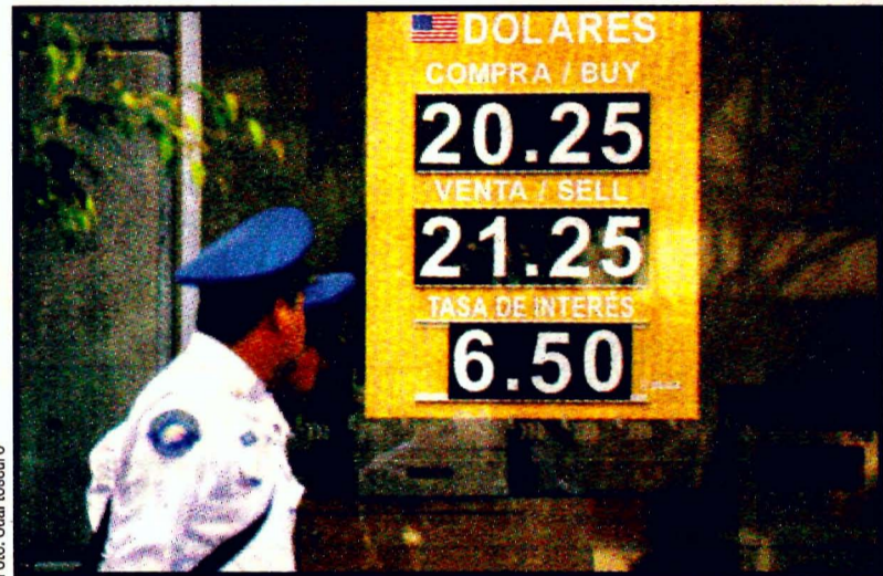
Continúa la devaluación del peso. Hasta 21.25 en casas de cambio.