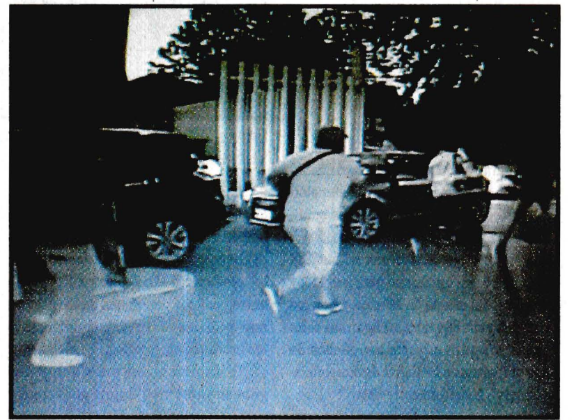
Un negocio en Plaza Tezontle fue robado por un grupo de malandrines, que rompió con mazos los cristales de los aparadores y se llevó la mercancía.