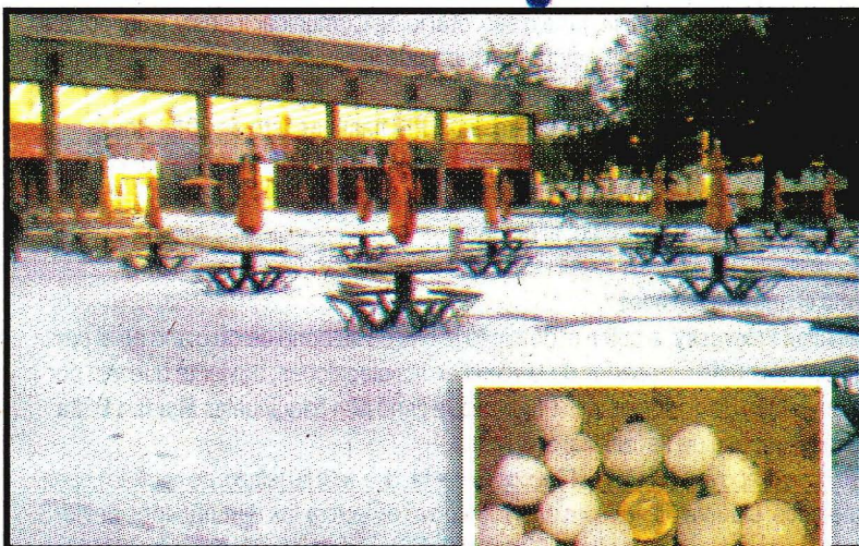
Granizos del tamaño de una moneda de diez pesos.