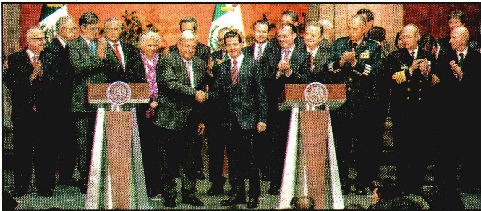
Enrique Peña Nieto y Andrés Manuel López Obrador. Reunión en Palacio Nacional.

"Hoy se da este paso inédito por las características propias y condiciones particulares de tener dos equipos de transición ya definidos (...). El