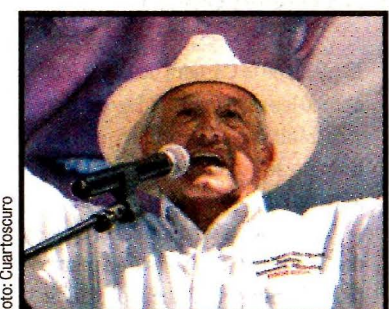
Andrés Manuel López.