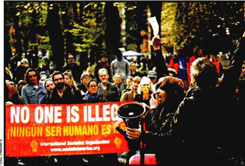
NUEVA YORK.- En las universidades, donde se da el conocimiento, y productoras de críticos por naturaleza, rechazan el plan de Trump.