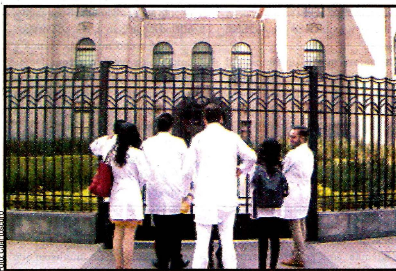
Médicos residentes acudieron a la Secretaría de Salud a exigir que les paguen.