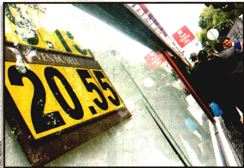
El dólar perdió terreno ante el peso, tras el anuncio del Banxico.

De igual forma, aseguró que se mantendrá vigilante de la posición monetaria relativa entre