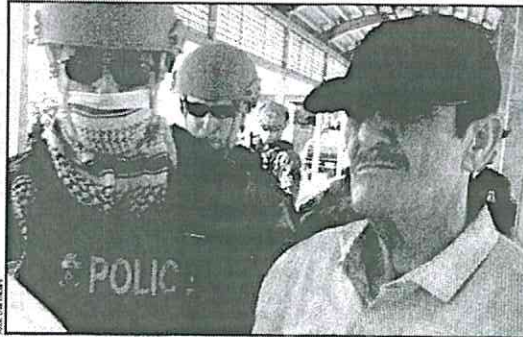
MATAMOROS, Tamaulipas. Héctor El Güero Palma Salazar, fundador del cartel del Sinaloa, fue entregado en el puerto de esta ciudad, fronteriza con Brownsville, Texas. Han pasado los años y físicamente lo refleja.

Alrededor de las 20:00 horas subió a una aeronave de la PGR en la que voló directo al hangar de esta dependencia en el Aeropuerto Internacional de la Ciudad de