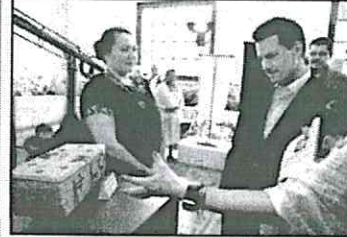
Enrique Peña Nieto. Exhibición de artesanías generadoras del Gobierno del Estado de Sinaloa, Gran Premio de Artes Populares. Artesanos a la formalidad, para que realicen beneficios. Ver página 2