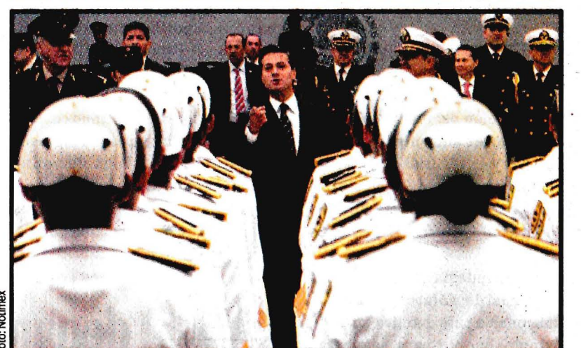
Enrique Peña Nieto encabezó los festejos por el Aniversario 100 de la Escuela Médico Militar e inauguró y recorrió las nuevas instalaciones de la Escuela Militar de Enfermeras.