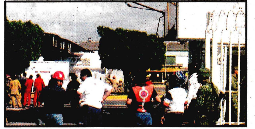
SALAMANCA, Gto.- Siete lesionados y una trabajadora muerta, saldo del estallido en la refinera de Pemex. Indagan las causas. Ver página 5