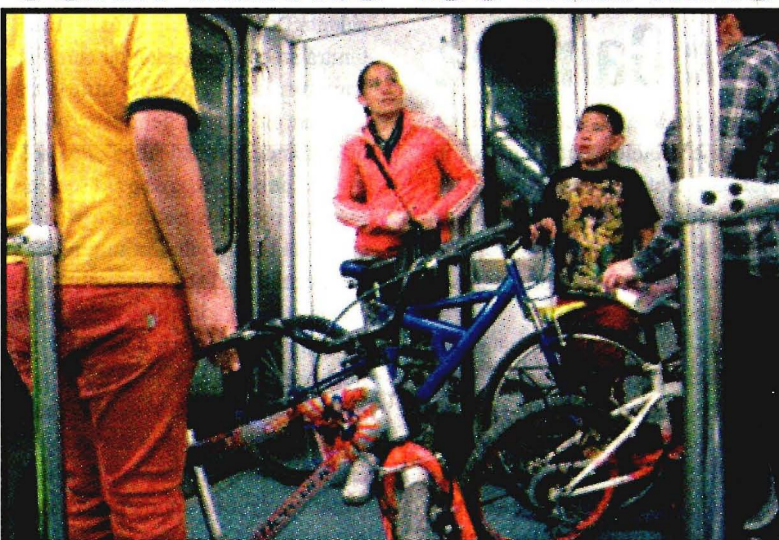
Miguel Angel Mancera reveló que por el gasolinazo, el Metro se ha convertido en la opción para ahorrar. No subirá el pasaje. Ver página 8