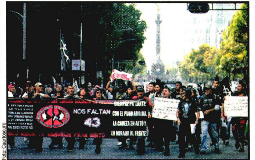
Quince días de protestas contra el gasolinazo. Ayer hubo en al menos diez entidades del país. Ver página 8