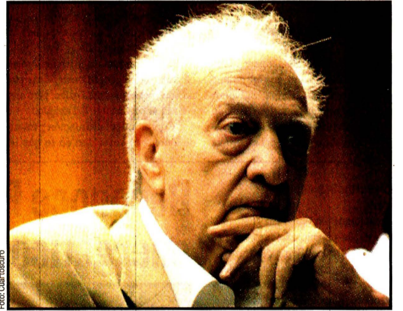
Sergio Pitól trenía 85 años de edad. Ganador del Cervantes, en 2005. Las letras están de luto.