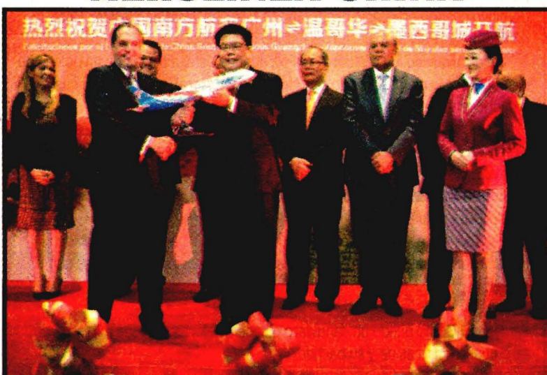
Inauguración del vuelo de la aerolínea china Southern Airlines en la ruta Guangzhou-Vancouver-Ciudad de México. Primero de una empresa china a México, y primero de dicha compañía a América Latina.