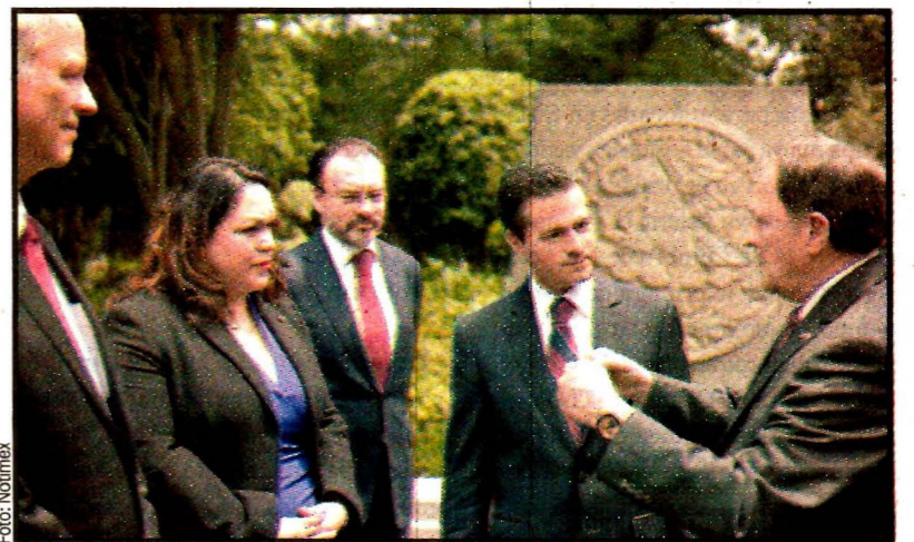
Enrique Peña Nieto y el gobernador republicano de Utah, Gary Herbert, quien es defensor de los mexicanos en su estado. Recepción en Los Pinos.