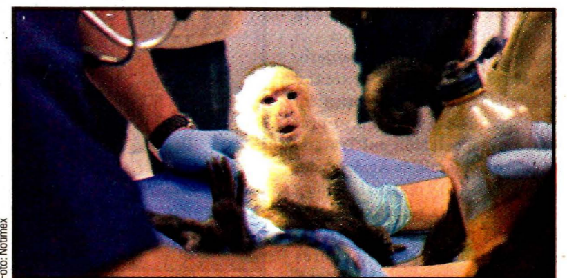
Estaba en Sierra Mil Cumbres, en las Lomas.