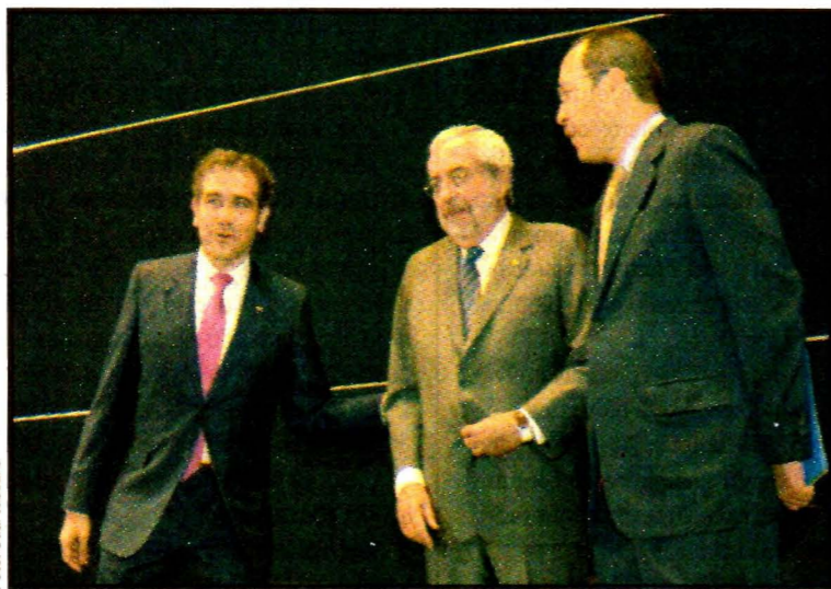
Lorenzo Córdova, Enrique Graue y Ciro Murayama.

¿Cuáles fueron las irregularidades realmente insubsanables para el INE?