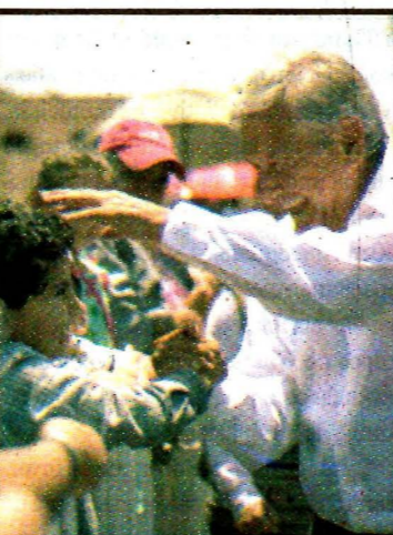
FRESNILLO, Zac.- Andrés Manuel López Obrador.

Sorpresa, pero debe acatarse, dice Anaya