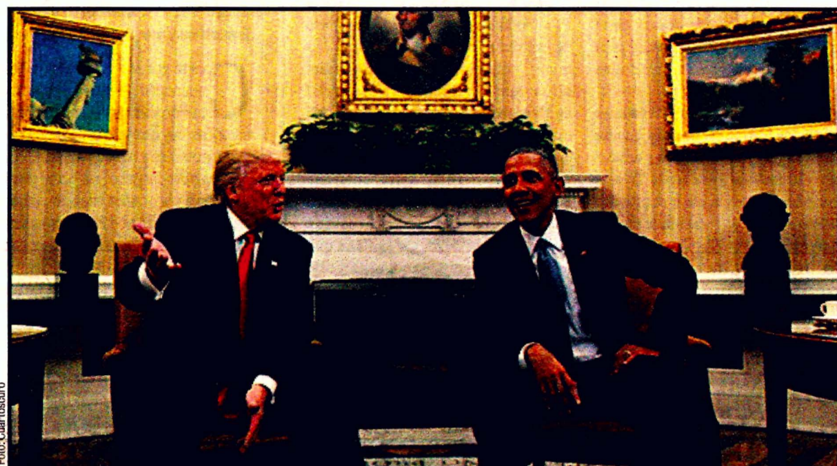
WASHINGTON, EU.- Donald Trump y Barack Obama, en la Casa Blanca. "Quiero reunirme más veces", dijo.