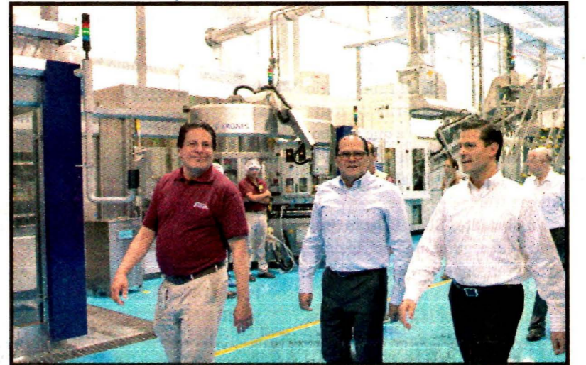
TECAMAC, Méx.- Enrique Peña Nieto inauguró la Planta Tecamac de Grupo PeñaFiel. "Peña-Fiel es la marca del presidente Peña", bromeó.