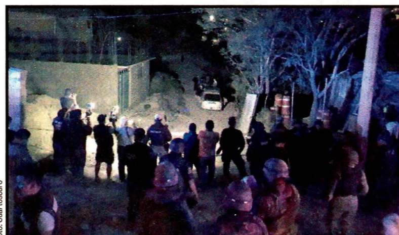
CHILPANCINGO, Gro.- Fin de semana violento. La madrugada del lunes fue encontrada una camioneta con ocho cuerpos.